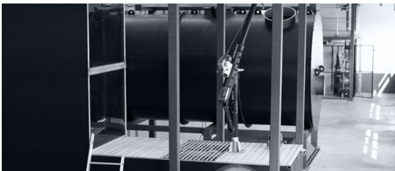
Campo prova Formazione ambienti confinati