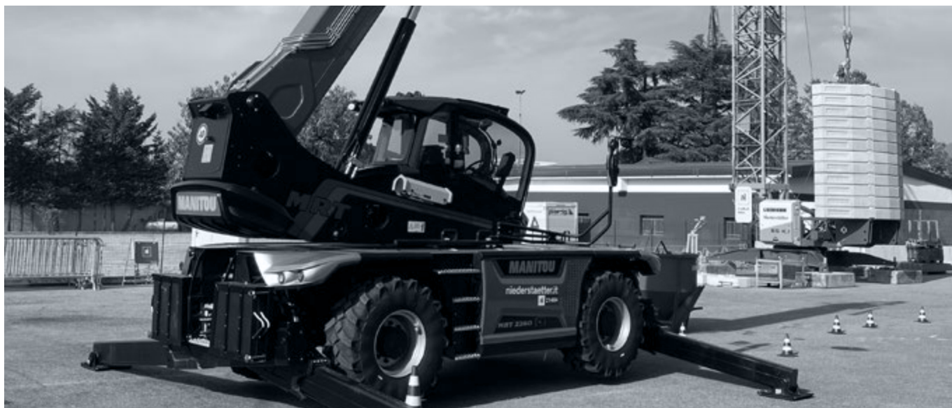
Campo prova Formazione attrezzature