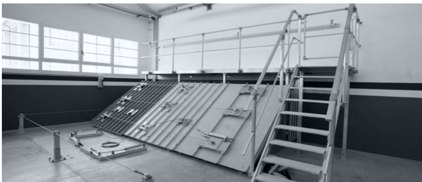
Campo prova Formazione DPI per lavori in quota