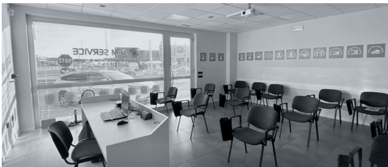
Corsi in aula